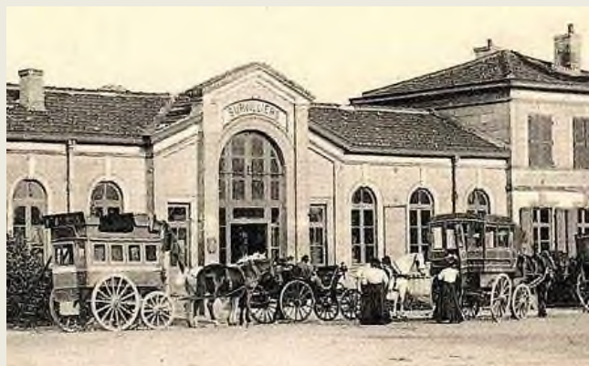
Gare de SURVILLIERS vers 1890

(2) La ligne de Paris à Creil avait été ouverte en 1849, celle de Paris à Luzarches, en 1882.